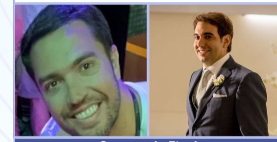
Quartas de Final