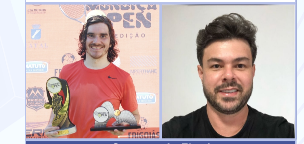
Quartas de Final