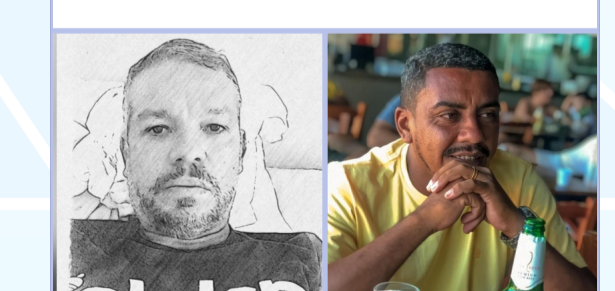
Quartas de Final